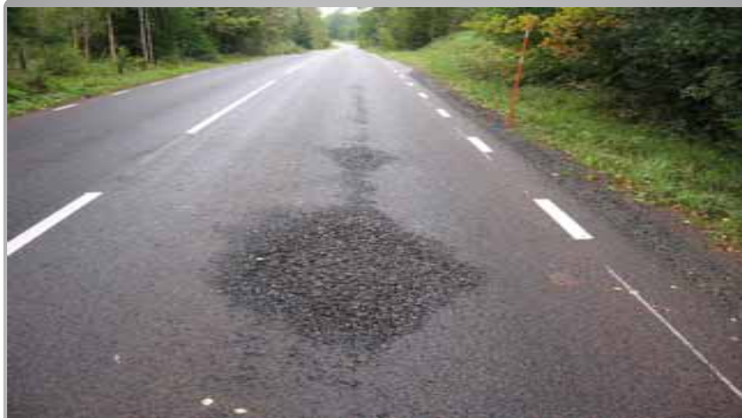
Plogskada, åtgärdas med försegling