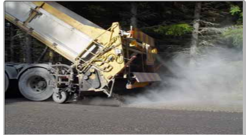
Försegling Emulsion + avsandning med 2/6