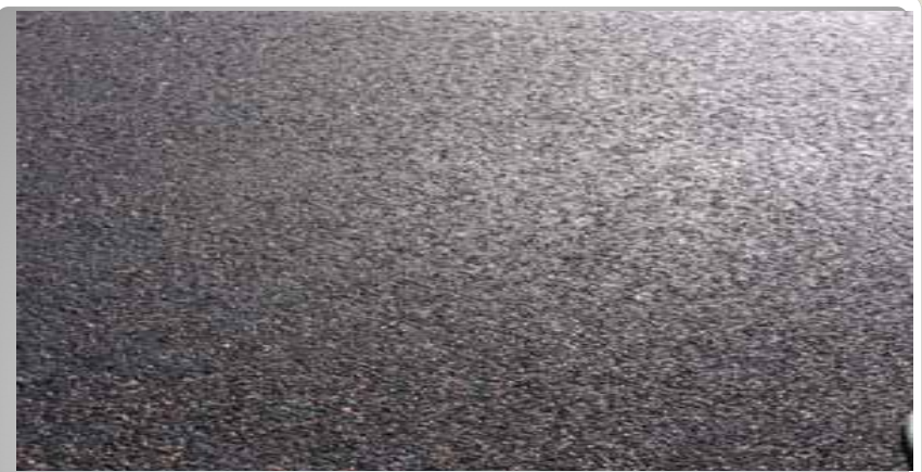
IMT 40 8/22 + 4/8 + 2/4