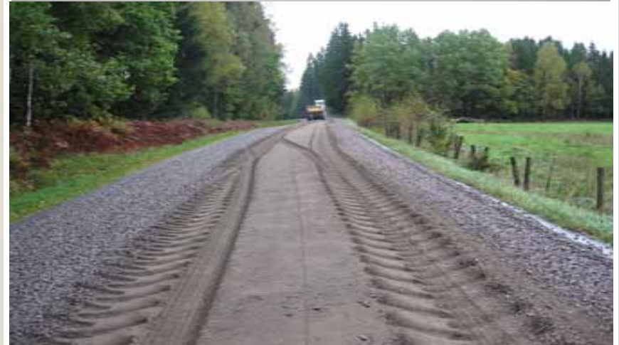
Förstärkning genom infräsning av makadam