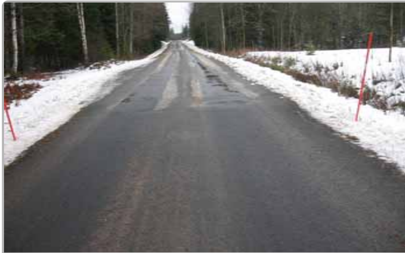
IMT är värmeisolerande