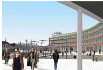
Illustration: Brunberg & Forshed