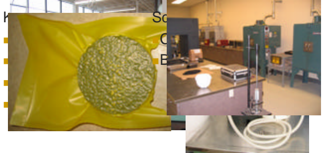
SR-138 LA County